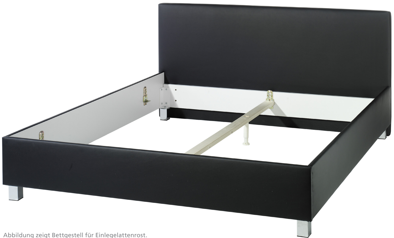
Abbildung zeigt Bettgestell für Einlegelattenrost.